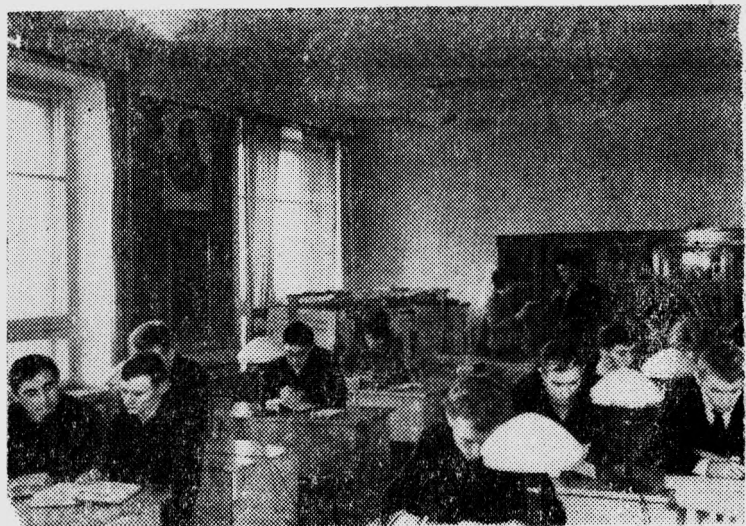
В кабинете истории КПСС в период подготовки к экзаменам.